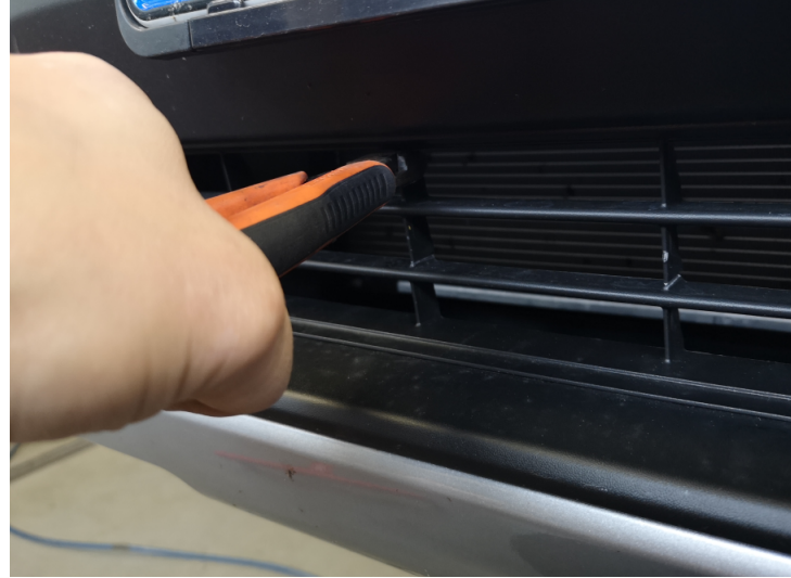
Klipp eller såga upp hål i grillen för LED-rampen