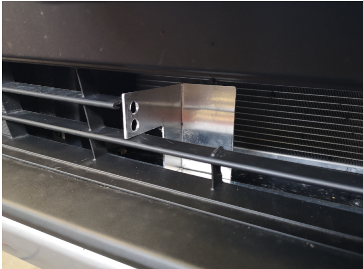
Provplacera fästena. Montera sedan LED-rampen ihop med fästena och placera hela paketet i grillen.