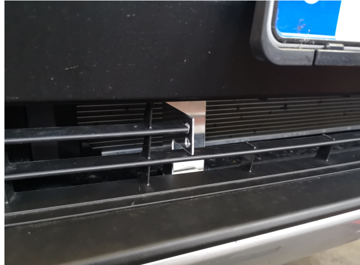
Skruva i två självborrande skruvar underifrån, lossa LED-rampen, och sätt en tredje skruv ovanifrån. Montera sedan tillbaks LED-rampen.